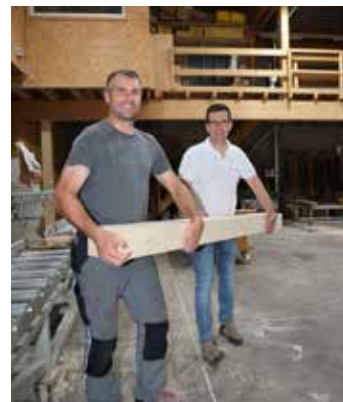
Der Stamm wird in verschiedene Schnittwaren zerlegt.

Vertragsabschluss: Bevor sie mit der Holzernte beginnen, schließen Waldbesitzer:innen und Holzkäufer:innen einen